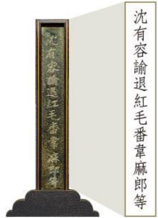
沈有容諭退紅毛番韋麻郎等

甲生：「長濱文化是臺灣舊石器時代早期的文化類型。」 乙生：「長濱文化位於臺灣的西部，屬於南島語族文化的一部份。」 丙生：「自長濱文化出土後，迄今臺灣的石器文化遺址都是海邊的洞穴出土。」 丁生：「從長濱文化遺存可知，他們以採集、漁獵為主要的維生方式。」